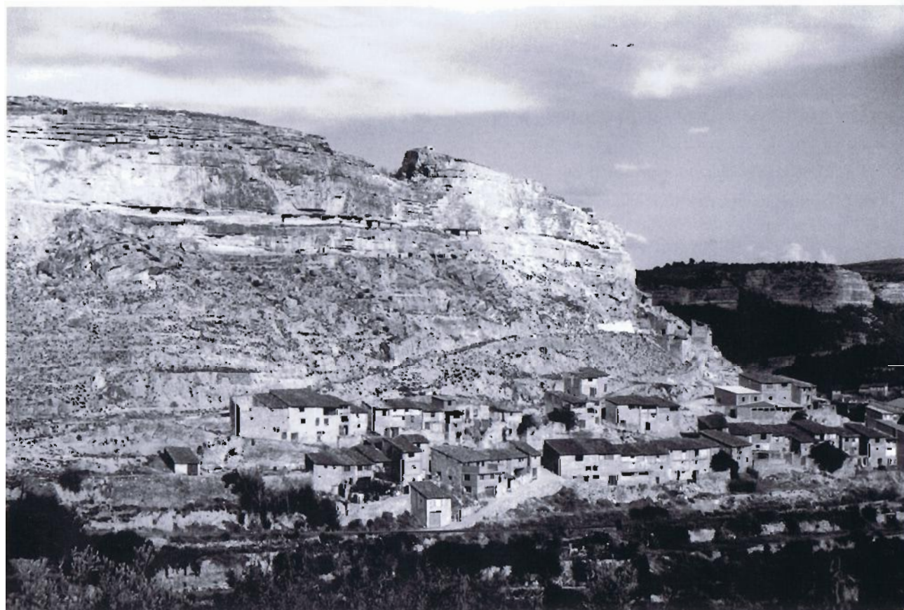
El flanco mejor conservado de Ademuz revela todavía las claves materiales y orográficas de su relación con el paisaje circundante

los residentes y responsables públicos de la comarca y la realización de diversas acciones concretas de salvaguarda, conservación y restauración de su arquitectura vernácula. Estos autores confían en que este tipo de iniciativas puedan surgir en muchos otros núcleos tradicionales en aras a preservar el carácter y la cultura material de nuestra rica geografía de asentamientos rurales.