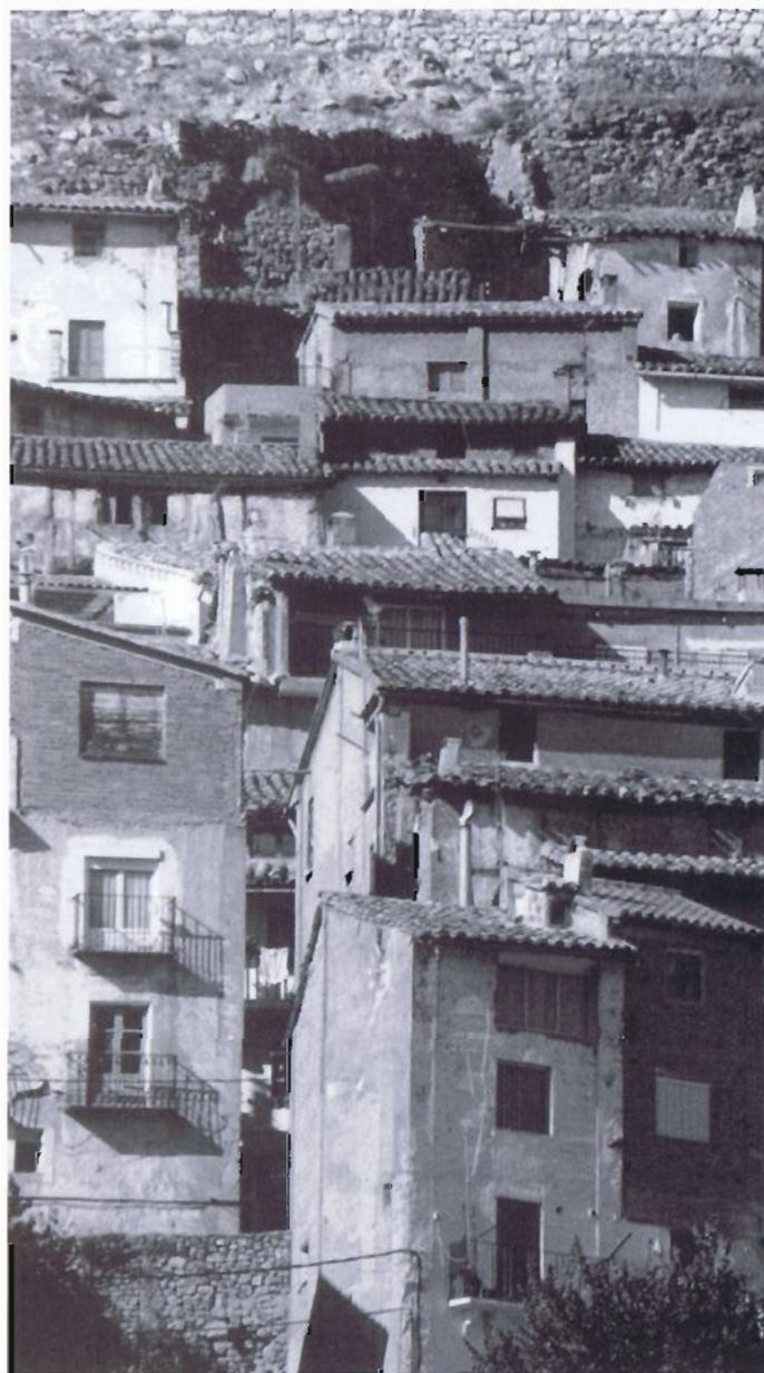
El escalonamiento propio del centro de Ademuz sigue caracterizando el centro histórico no obstante las sustituciones y demoliciones de la actualidad