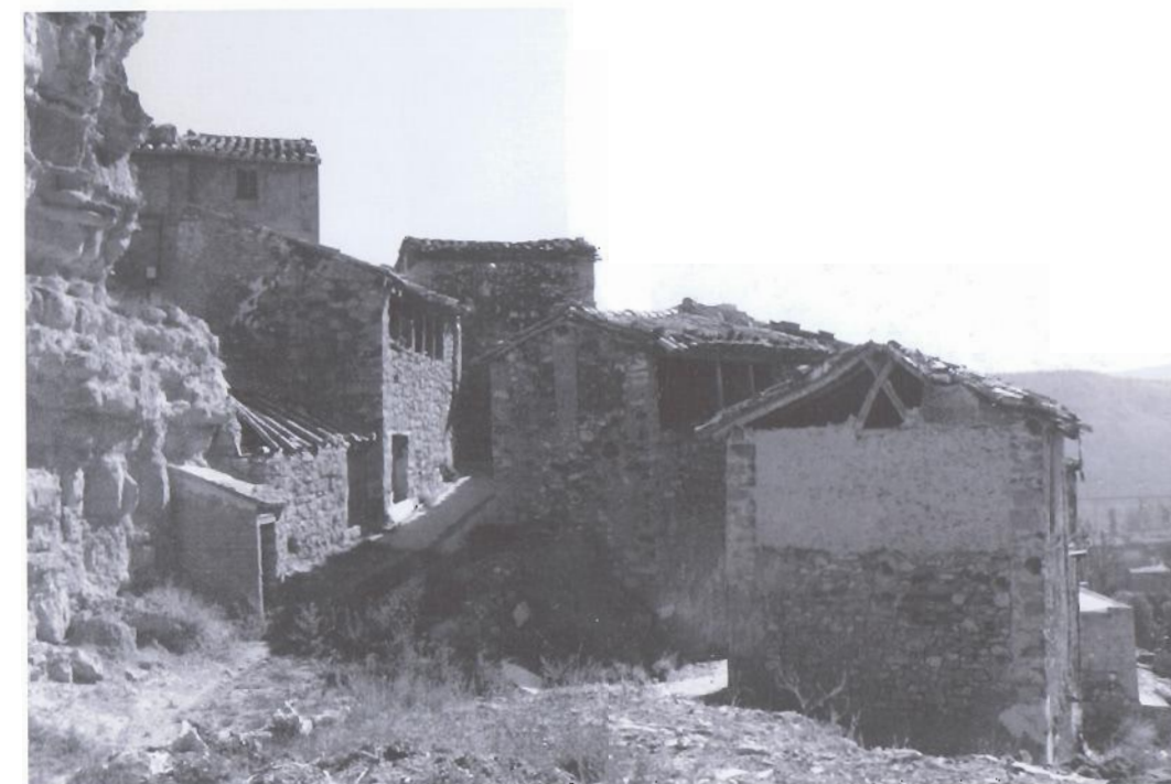
En la corona superior de este pueblo se conservan intactas un tejido de construcciones vernáculas que constituyen el precioso testimonio de la cultura material de la localidad, a la espera de su restauración.